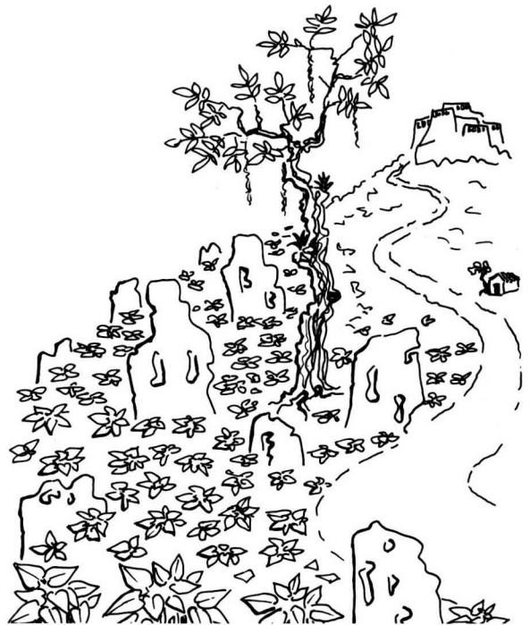
Fig 1. Dessin représentant la situation des cultures de haricots sur une pente abrupte, entre des rocs de calcaire dolomitique, au bord du chemin qui mène à la citadelle du Roi Christophe, en Haïti (novembre 1971).

De ce fait, en plaine, les seuls semis possibles se situent en décembre, grâce aux pluies (plaine du cap Haïtien régulièrement soumise aux pluies de «fronts froids»), ou à l'irrigation (plaines de la péninsule du Sud). C'est en plaine que Vigna un-