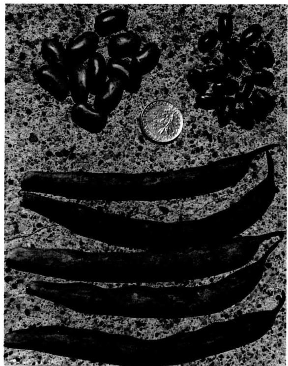
Fig 4. La lignée «CNR 11» gousse grouge vif uni, grains écosés frais à gauche, grains secs à droite. La pièce française de un franc donne l'échelle.