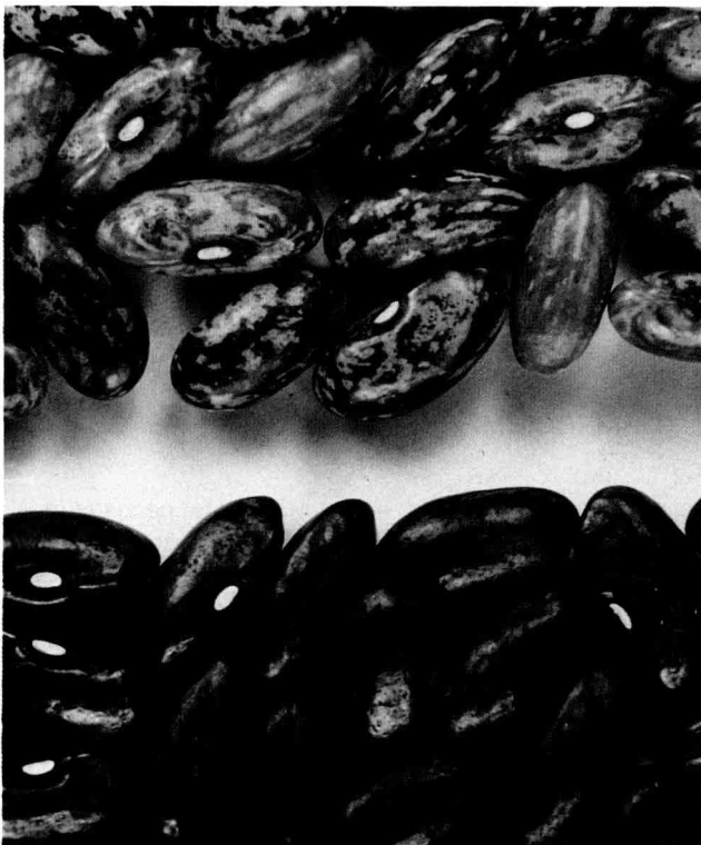
Fig 3. Coloration comparée de «Salagnac 86» (en haut) et de «Salagnac 90» (en bas).